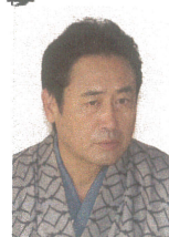
ふじの奉公先主人 永島敏行